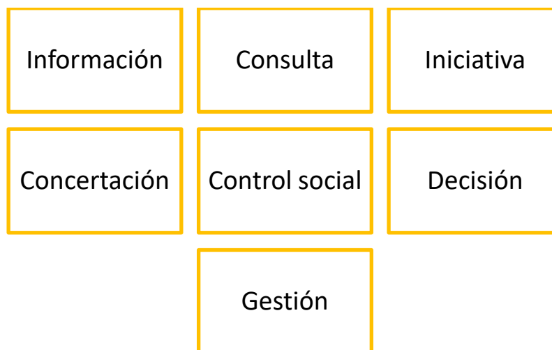
Ilustración 1. Alcance del proceso de participación ciudadana

Por lo anterior, la Lotería de Bogotá promueve el ejercicio de la participación ciudadana con las siguientes finalidades: