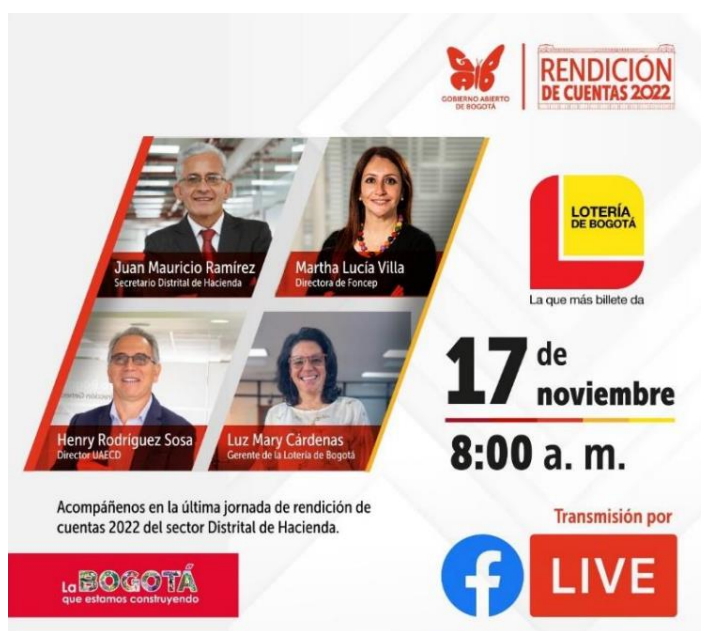
Ilustración 1. Invitación audiencia de rendición de cuentas sector hacienda 2022

Así mismo, en la entidad durante la vigencia 2022, se realizaron diferentes actividades de encuentros con partes interesadas (distribuidores, loteros, servidores públicos), se pueden consultar en los informes de rendición de cuentas semestrales publicados en la página web.