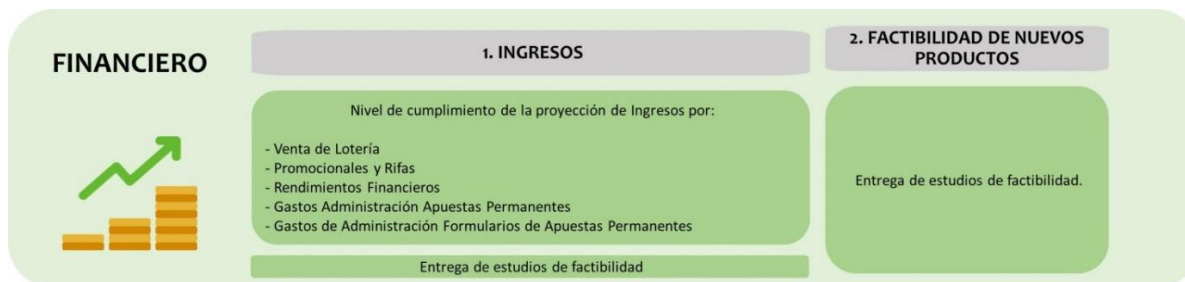
Ilustración 1 Eje Financiero