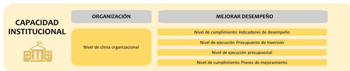
Ilustración 3 Eje Capacidad Institucional

Este eje estratégico cuenta con dos objetivos y cinco (5) indicadores, tal como se evidencia en la siguiente ilustración: