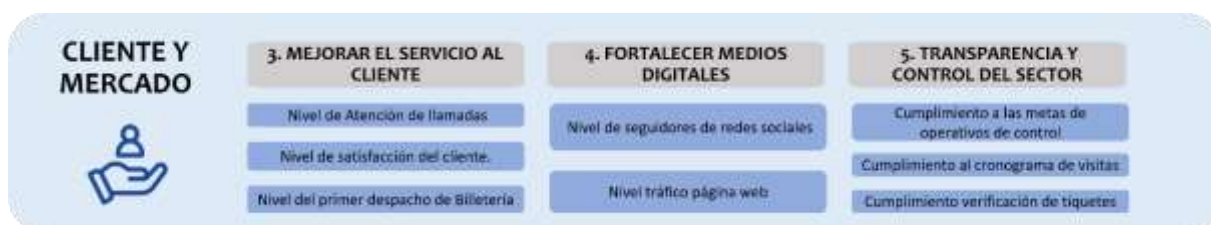
Ilustración 2 Eje Cliente y Mercadeo

Este eje cuenta con tres objetivos y 8 indicadores tal como se evidencia a continuación: