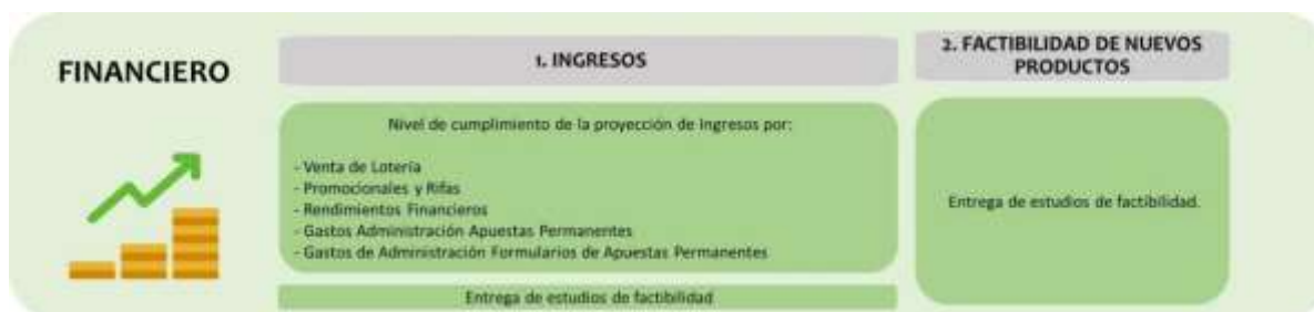
Ilustración 1 Eje Financiero

Cuenta con dos objetivos y tres indicadores tal y como se evidencia a continuación: