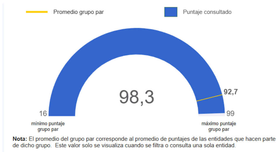
Ilustración 3: Resultados Índice de Control Interno Lotería de Bogotá 2023

El indicador estratégico corresponde al Índice de Control Interno, evaluado anualmente por el Departamento Administrativo de la Función Pública (DAFP) con corte de vigencia vencida., la Lotería de Bogotá obtuvo los siguientes resultados: