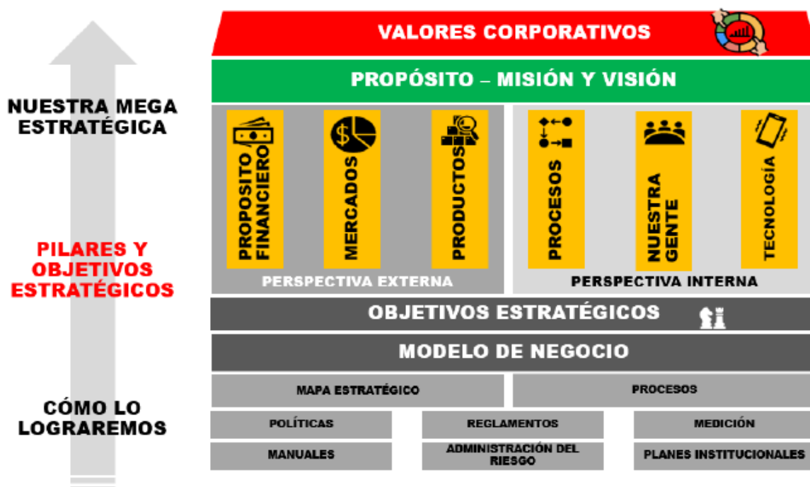
Ilustración 1 Modelo Integrado de Gestión - Lotería de Bogotá